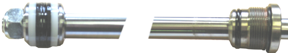
Montage type B